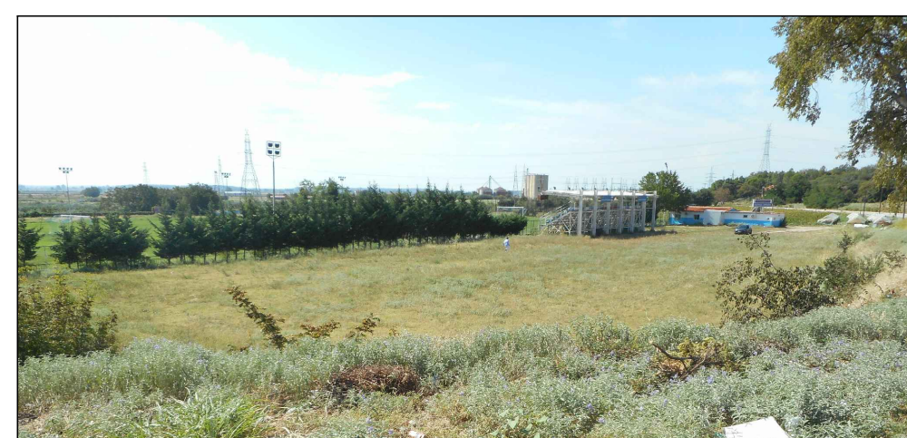
ΦΩΤΟΓΡΑΦΙΑ ΑΠΟ ΘΕΣΗ ΛΗΨΗΣ 1