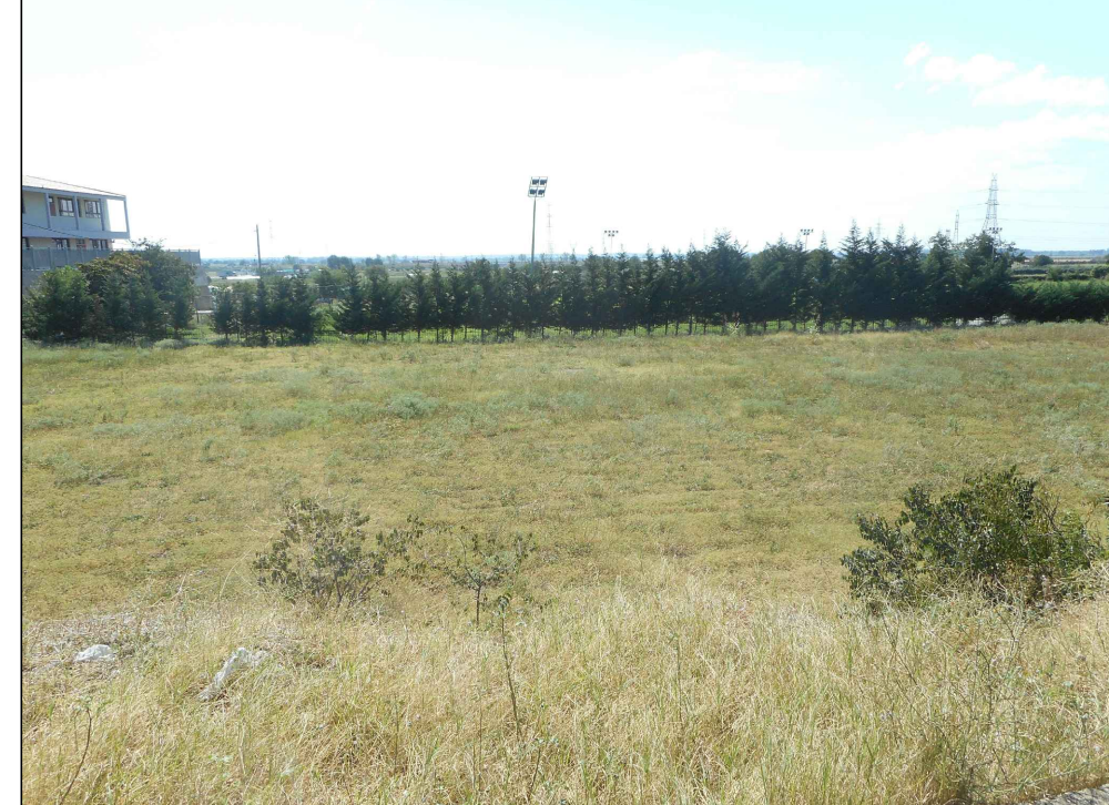
ΦΩΤΟΓΡΑΦΙΑ ΑΠΟ ΘΕΣΗ ΛΗΨΗΣ 2