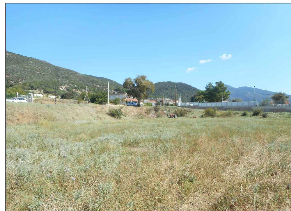
ΦΩΤΟΓΡΑΦΙΑ ΑΠΟ ΘΕΣΗ ΛΗΨΗΣ 3