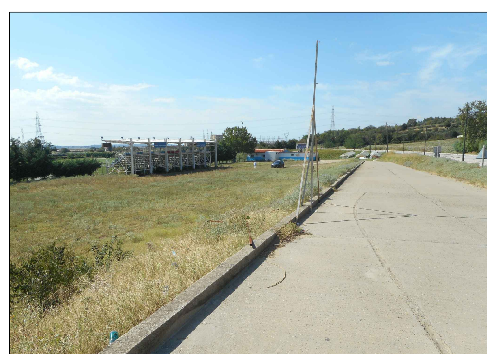
ΦΩΤΟΓΡΑΦΙΑ ΑΠΟ ΘΕΣΗ ΛΗΨΗΣ 4